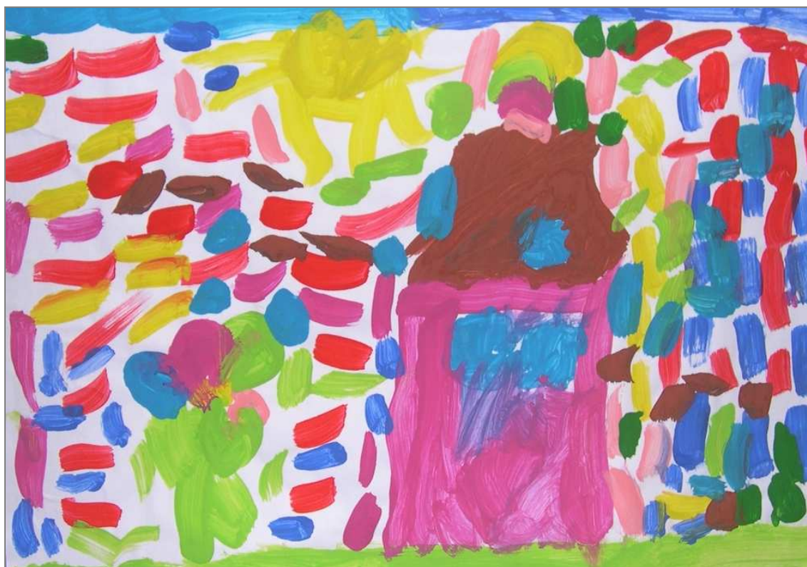
Kopshti im është e bukur brenda dhe jashtë

Hyrja në kopsht është edhe momenti kur prindërit u besojnë një pjesë të edukimit dhe të rritjes së fëmijës së tyre, të rriturve të tjerë me të cilët ai do kalojë pjesën më të madhe të ditës. Pra fillon një fasë delikate, në të cilën edukatorët janë përkrah prindërve për të njohur fëmijën deri në fund dhe për ta ndihmuar gjatë ndarjes prej e tyre duke mbajtur në vetvete imazhin e të dashurve dhe garancinë e kthimit tek ata, pasi kanë kaluar një pjesë të kohës me figura të tjera. Për kopshtin, do vit, është vit i ri, sepse të gjithë fëmijët janë të veçantë në unicitetin e tyre dhe në atë të familjeve, janë të ndryshme edhe dinamikat e grupeve që formohen dhe lojërave të krijuara me të cilat luajnë.