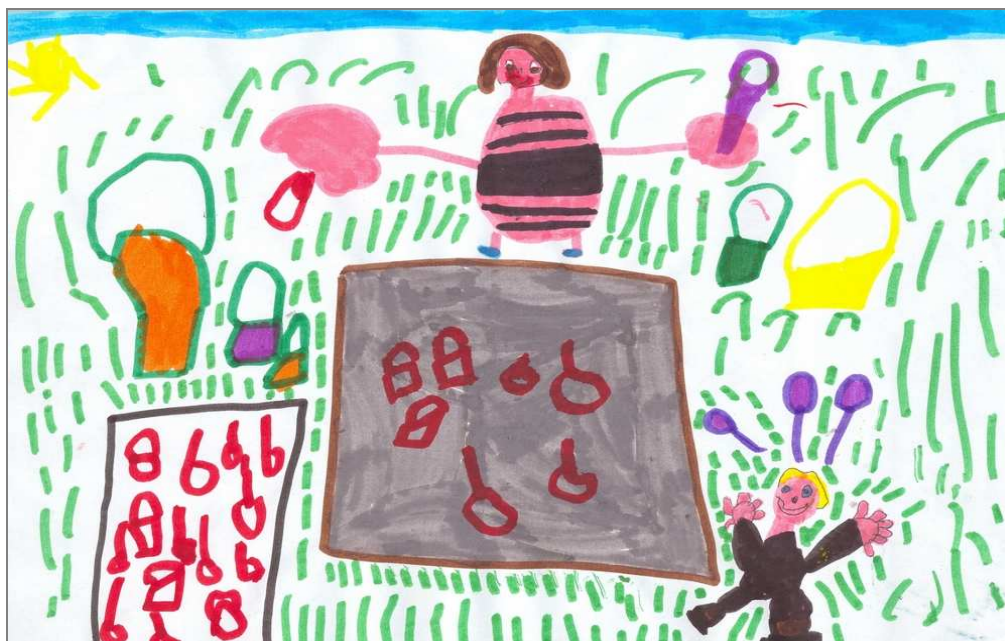
Në vrimën e rërës un punoj shumë.

Ndër aktivitetet e sistemit parashkollor (kopshtit), gjinden edhe ato të vazhdueshmërisë edukative me çerdhen dhe me shkollën fillore, në të cilat fëmijët vihen në kontakt me shokët më të mëdhenj. Janë takime që zhvillohen me ndonjë temë të posaçme, por kanë si synim kryesor të ndihmojnë kalimin sa më natyral nëpërmjet njohjes së ambienteve të reja. Kështu fëmijët arrijnë të parashikojnë rrugën e tyre të rritjes.