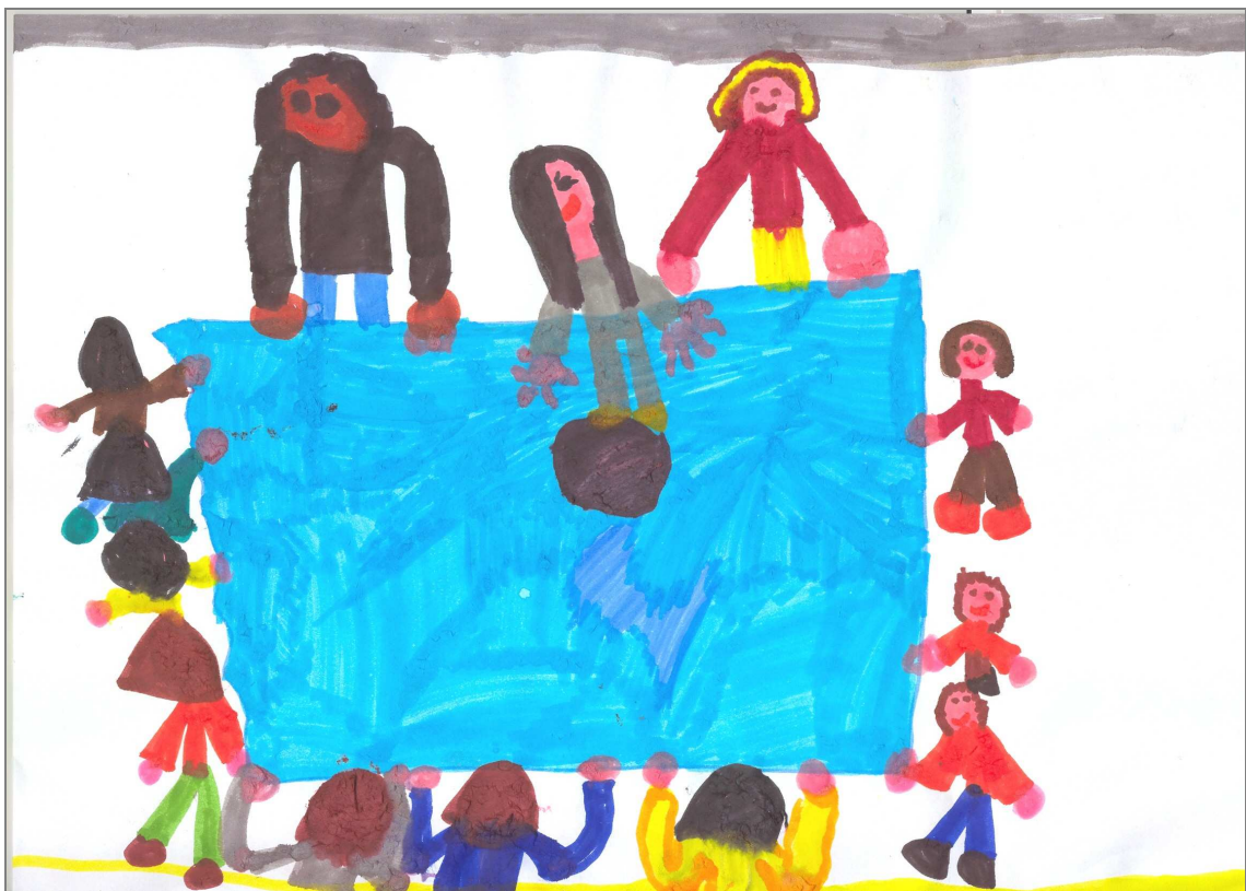
Eu cu grupa mea mă distrez mult

proiecte educative și activități didactice. Sunt și întâlniri individuale unde se discută despre copil, de experiențele trăite în grădiniță, despre prieteni și jocuri preferate și despre progresul făcut. Sunt momente importante pentru a împărtăși alegerea educativă, a înțelege sensul regulilor și activităților propuse de grădiniță.